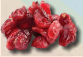
ARÁNDANO BOLSA DE 1KG