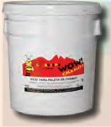
CHAMOY CUBETA DE 20 KG