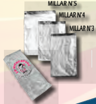
MILLAR DE BOLSA DEL N°5, N°4, N°3