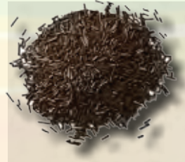
GRANILLO DE CHOCOLATE CAJA DE 5 KG