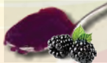
MERMELADA DE ZARZAMORA CUBETA DE 25 KG