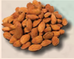
ALMENDRA ENTERA BOLSA DE 1 MILLAR