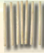
MINI BULTO DE 25 KG PALILLOS