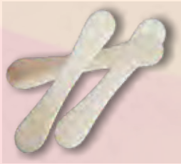
CUCHARA AMERICANO "HUESITO" CAJA DE 10 MIL PALILLOS