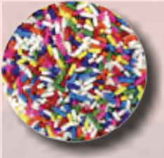
GRANILLO MULTICOLOR CAJA DE 5 KG