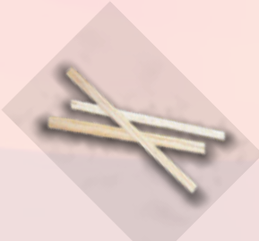
TROQUELADO BULTO 25 KG DE PALILLOS