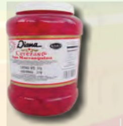
FRASCO DE CEREZAS DIANA DE 3.6 KG