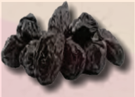
CIRUELA PASA BOLSA DE 1KG