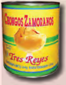
LATA DE CHONGOS ZAMORANOS DE 4 KG