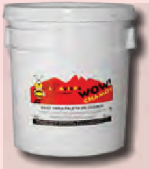
CHAMOYADA CUBETA DE 20 KG