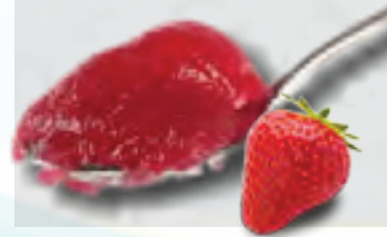
MERMELADA DE FRESA CUBETA DE 25 KG