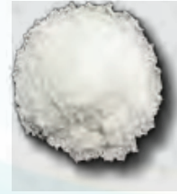
COCO RAYADO BULTO DE 25KG PALILLOS NO PULIDOS