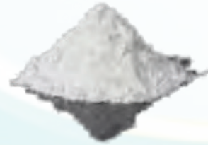
CLORURO DE CALCIO BULTO DE 36 KG