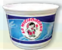
PARA HELADOS TOCUMBO ENVASE DE MEDIO LITRO CAJA DE 300 PZAS