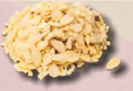
ALMENDRA FILETEADA BOLSA DE 1 MILLAR