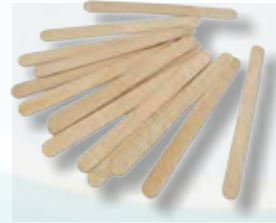
KIKOLETA BULTO DE 25KG PALILLOS NO PULIDOS