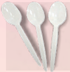
CUCHARA PASTELERA CAJA DE 3000 PZAS