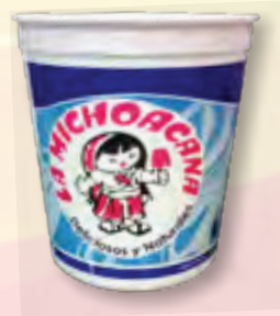
PARA HELADOS TOCUMBO ENVASE DE UN LITRO CAJA DE 250 o 300 PZAS